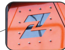
Okno dla operatora