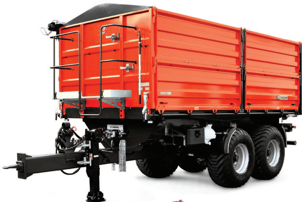
Przyczepa rolnicza ZASŁAW D-762-14 XL