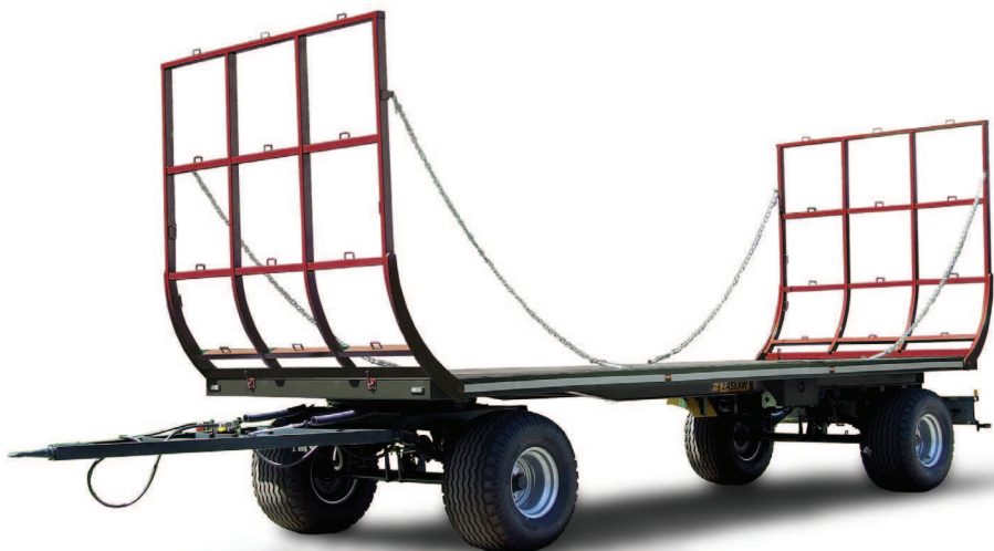
Przyczepa do przewozu bel ZASŁAW D-744-9 9 TON