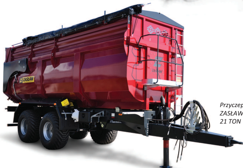
Przyczepa skorupowa rolnicza ZASŁAW D-764-21 1R 21 TON