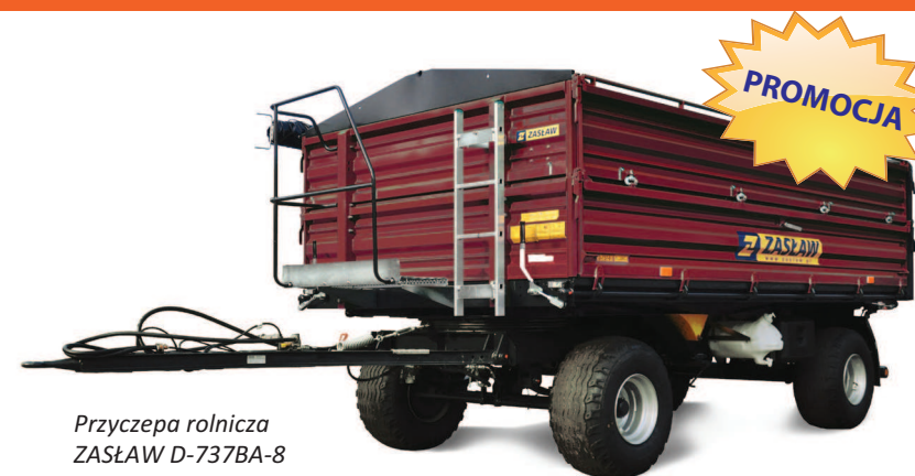
Przyczepa rolnicza ZASŁAW D-737BA-8 8 TON