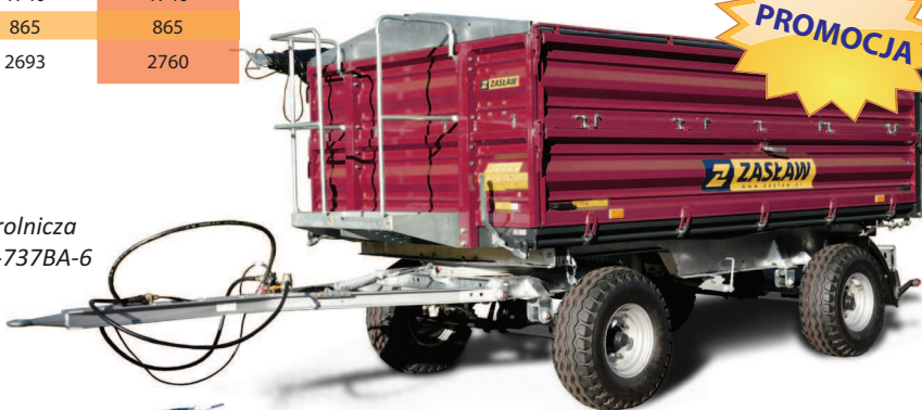
Przyczepa rolnicza ZASŁAW D-737BA-6 6 TON