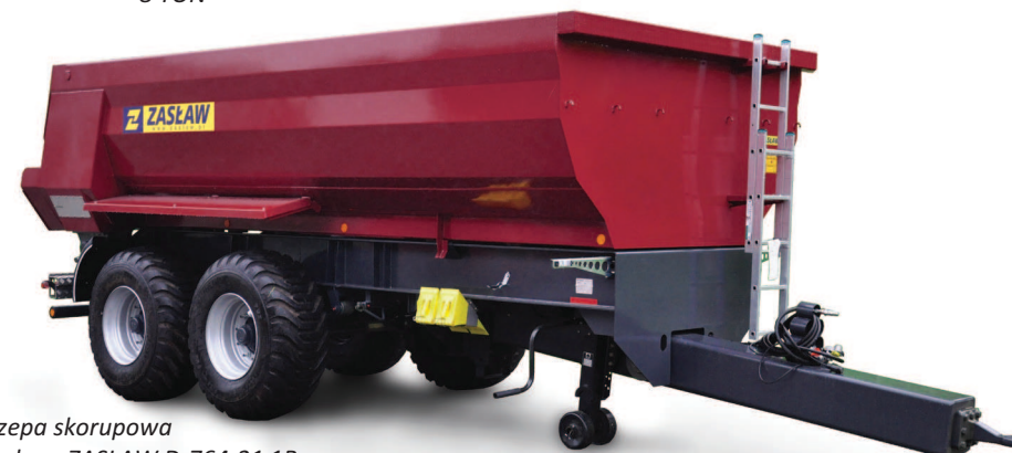
Przyczepa skorupowa budowlana ZASŁAW D-764-21 1B 21 TON