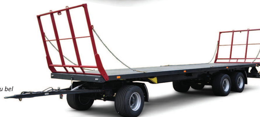
Przyczepa do przewozu bel ZASŁAW D-746-20 20 TON