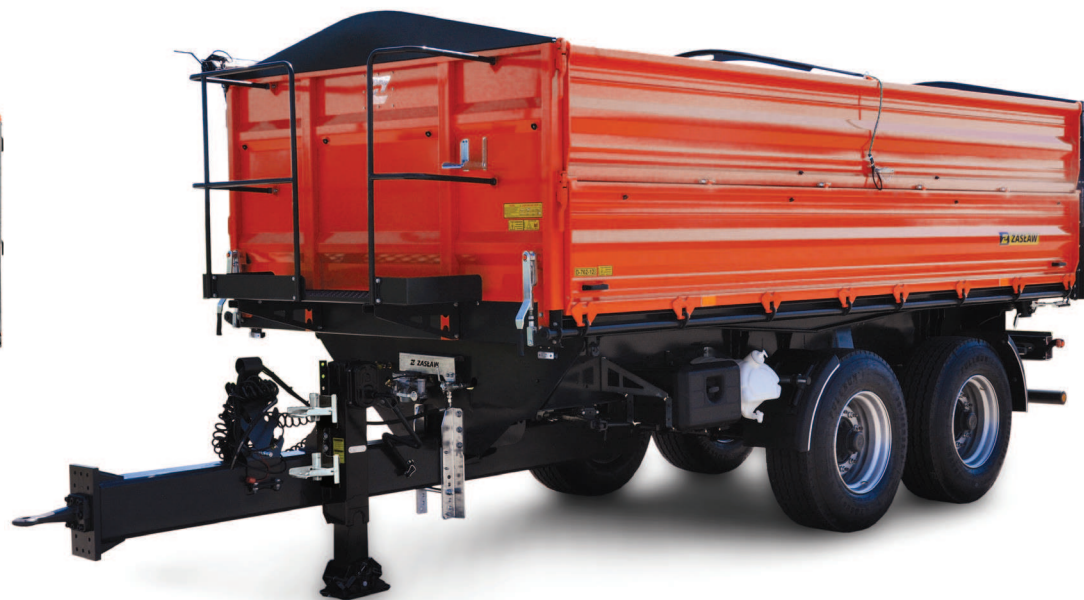
Przyczepa rolnicza ZASŁAW D-762-12 long