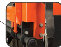
Ściana oparta o przednie obrzeże - podwyższona stabilność ściany