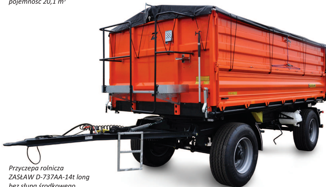
Przyczepa rolnicza ZASŁAW D-737AA-14t long bez słupa środkowego