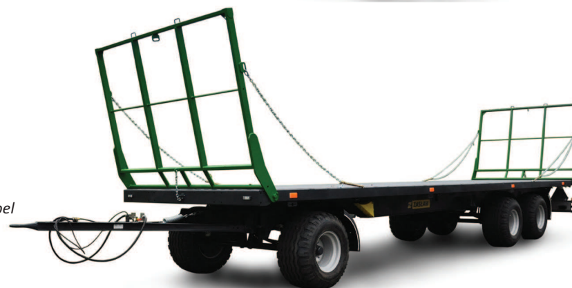
Przyczepa do przewozu bel ZASŁAW D-745-14 14 TON