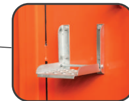
Zewnętrzne i wewnętrzne stopnie na przedniej ścianie