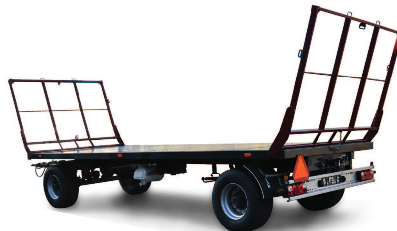
Przyczepa do przewozu bel ZASŁAW D-744-13 13 TON