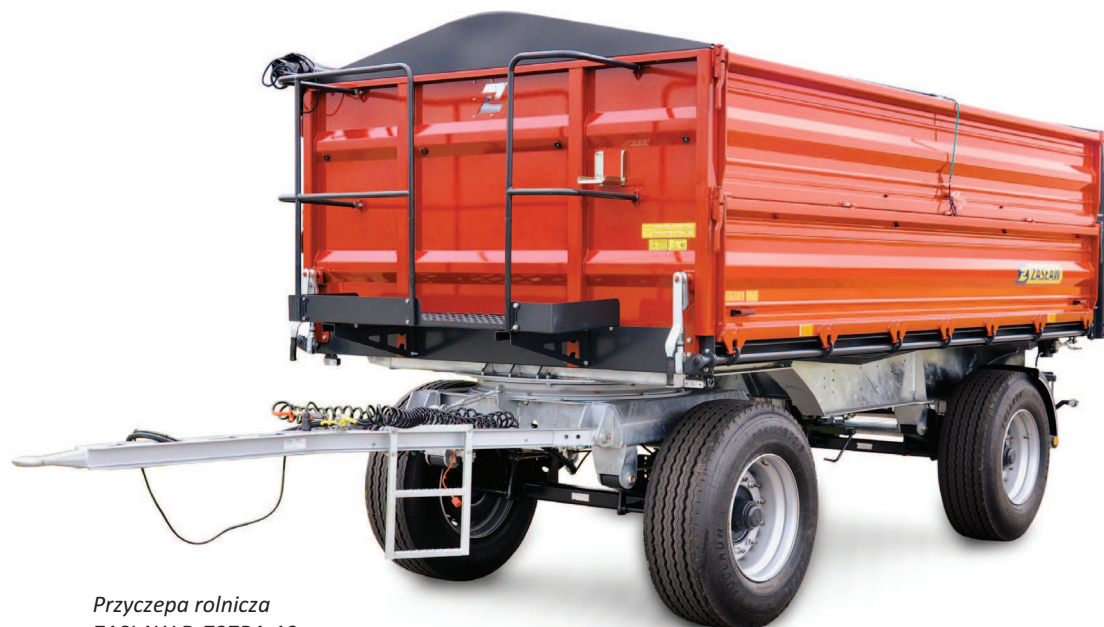
Przyczepa rolnicza ZASŁAW D-737BA-10