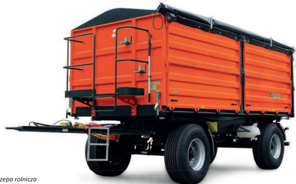
Przyczepa rolnicza ZASŁAW D-737AA-14t XL pojemność 20,1 m 3