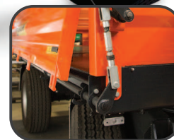
Nowa podłoga z arkusza blachy o grubości aż 5 mm, wykonywana na robocie spawalniczym. Obrzeża podłogi walcowane co zapewnia sztywność i precyzję wykonania