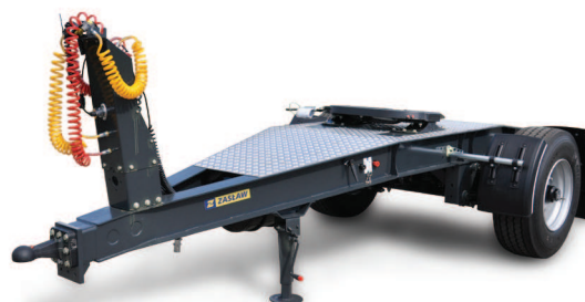
Wózek DOLLY ZASŁAW 385/65R22,5